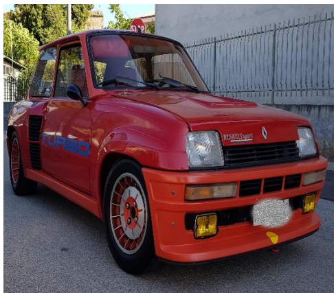
3/4 Anteriore destro