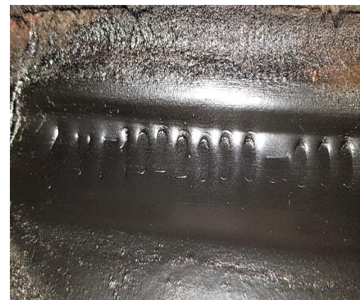
Numero di telaio

*N.B. PER LE VETTURE CABRIO O CON HARDTOP VANNO ESEGUITE LE FOTO SIA CON CAPOTE APERTA SIA CON CAPOTE CHIUSA.*