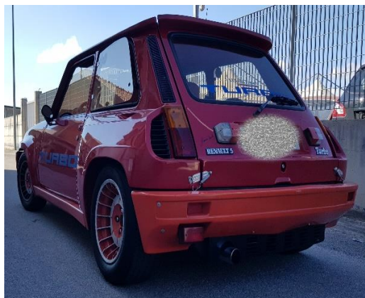
3/4 Posteriore sinistro